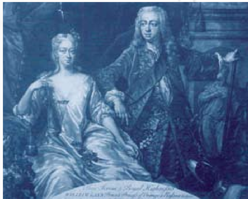
Willem IV en Anna van Hannover

Groningen stemt rood, maar onderhoudt sinds de achttiende eeuw ook innige betrekkingen met het Huis van Oranje. En die nauwe band met het vorstenhuis heeft de universiteit geen windeieren gelegd. Povere resultaten van de Nederlandse troepen in de Oostenrijkse Successieoorlog (1740–1748) stortten het