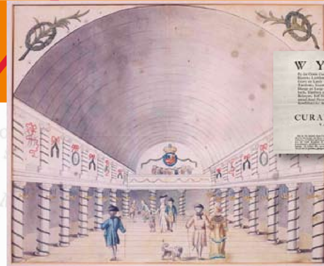
Bal voor koning Willem V en zijn vrouw op de versierde binnenplaats van het Academiegebouw (1777)

Ook de universiteit werd niet vergeten. Op zaterdag 29 november trok een plechtige stoet met de Prins van het Prinsenhof over de Grote Markt en door de Boteringstraat