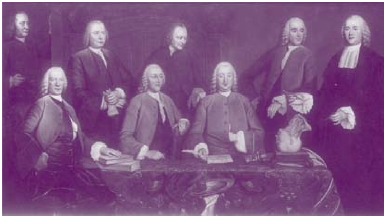
Anatomische les van Petrus Camper (geheel rechts). Schilderij Tibout Regters (1758)

Petrus Camper verrichtte baanbrekend werk in diverse wetenschapsgebieden. Of hoe een hoogleraar geneeskunde zich ontpopte tot een intellectuele veelvraat, die exotische dieren op de snijtafel legde.